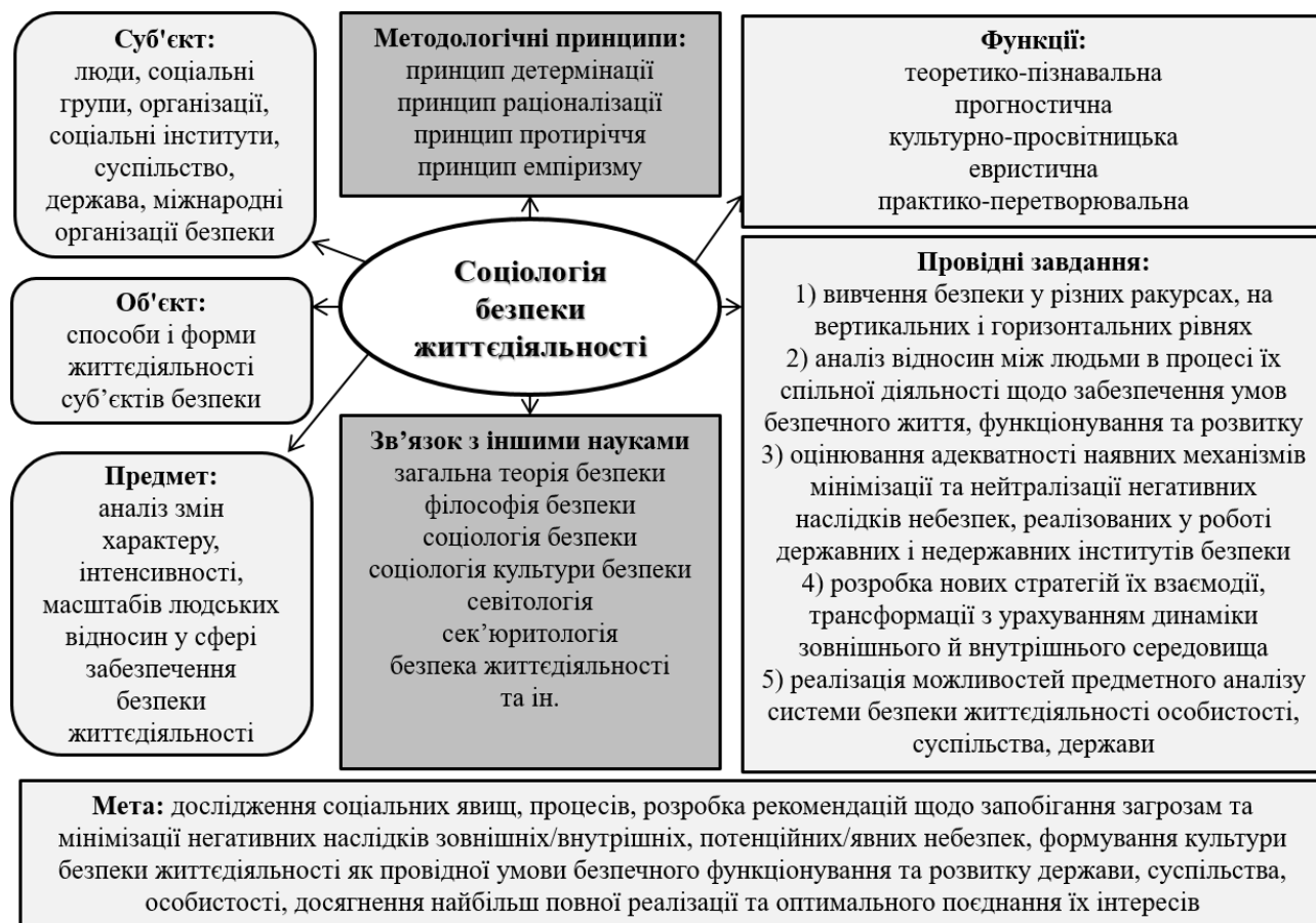
Рис. 1. Структурно-логічна схема складових соціології безпеки життєдіяльності (авторська пропозиція)

по-четверте, управління системою забезпечення життєдіяльності особистості, суспільства, держави; по-п'яте, формування особистості безпечного типу й популяризація культури безпеки життєдіяльності (рис. 1).