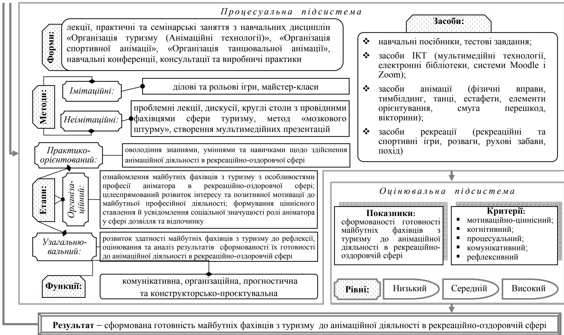
Рис. 1. Модель формування готовності майбутніх фахівців з туризму до анімаційної діяльності в рекреаційно-оздоровчій сфері