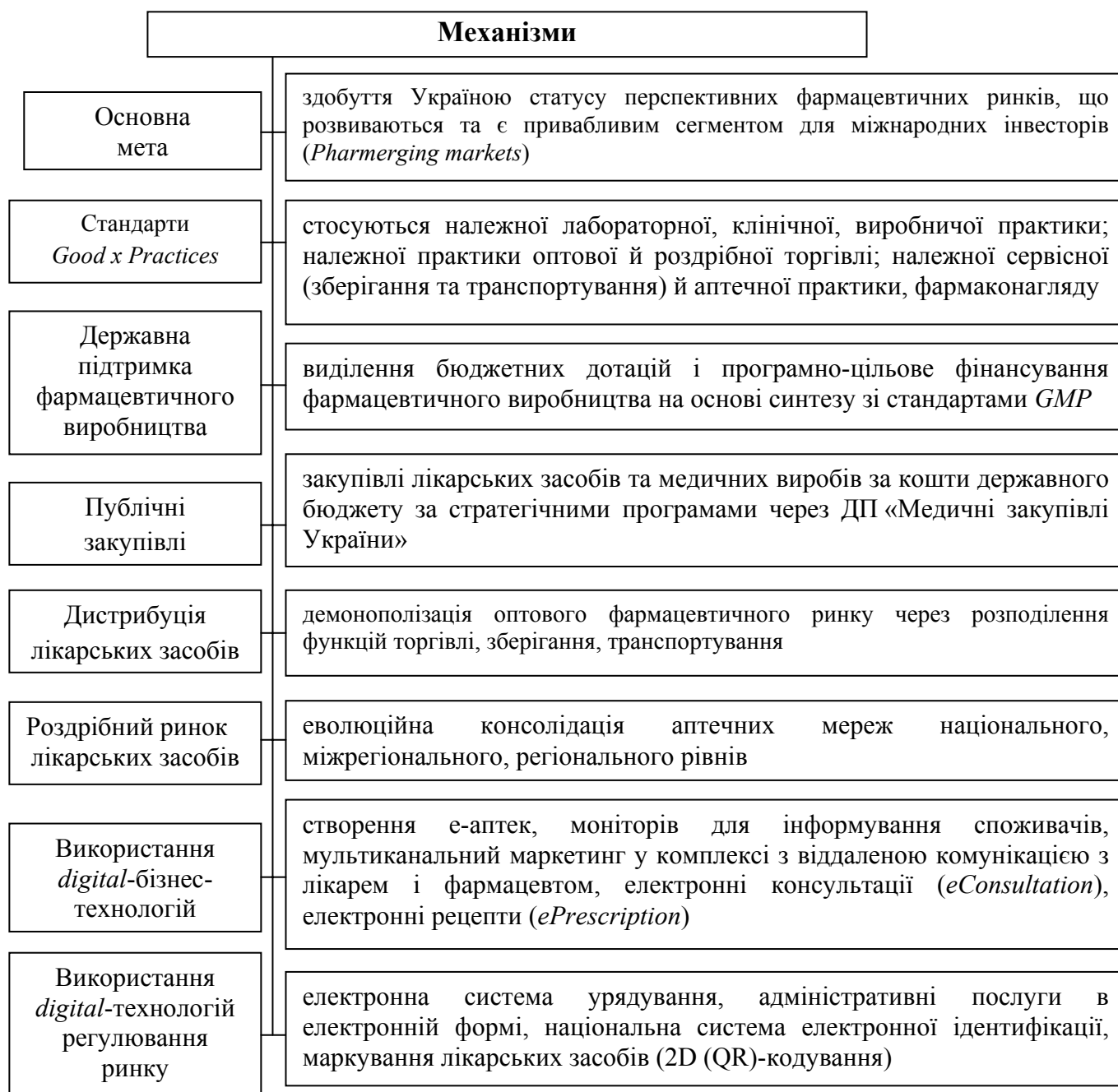
Рис. 3. Формалізація механізмів регулювання економічного потенціалу фармацевтичного ринку в умовах євроінтеграції (розроблено автором)

Узагальнено кількісні індикатори державного регулювання фармацевтичного ринку України. Стимулювальний вплив на його розвиток мають такі фактори: збільшення обсягів сертифікації GMP , зменшення кількості порушень за результатами планових перевірок дотримання ліцензіатами вимог щодо забезпечення якості лікарських засобів. Дестимулювальними факторами є: значний обсяг розпоряджень і приписів щодо заборони реалізації, зберігання та застосування неякісних, незареєстрованих, фальсифікованих лікарських засобів, а також ввезених на територію України з порушенням законодавства; зростання питомої ваги відхилених заявок на ліцензування аптечних закладів за результатами передліцензійних перевірок; збільшення обсягів анулювання ліцензій за плановими й позаплановими перевітками.