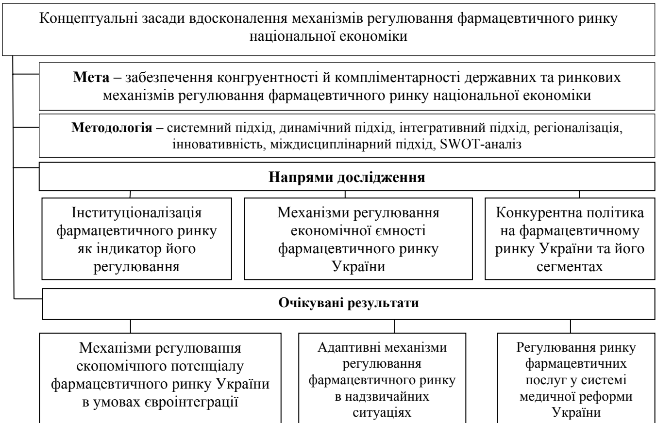
Рис. 1. Формалізація концептуальних засад удосконалення механізмів регулювання фармацевтичного ринку національної економіки (розроблено автором)

Основними з них визначено такі: механізми регулювання економічного потенціалу фармацевтичного ринку України в умовах євроінтеграції, адаптивні механізми регулювання фармацевтичного ринку в надзвичайних ситуаціях, регулювання ринку фармацевтичних послуг у системі медичної реформи України.