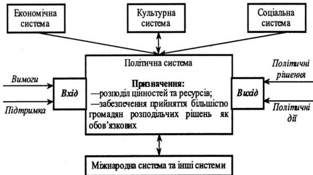
Рис. 1.2.3. Модель політичної системи за Істоном

На кінцевому етапі відбувається замикання зворотного зв'язку, як і в моделі Д. Істона, оскільки результати діяльності політичної системи в зазначених функціях видобування, регулювання та розподілу ресурсів мають трансформувати соціальну систему й призвести до посилення або послаблення політичної системи. Звісно, модель Алмонда, попри її доволі високий рівень абстрагування, також ставала об'єктом критики, передусім через деяку замкненість і циклічність, які в реальному соціальному житті виявляються недосяжними або малодосяжними.