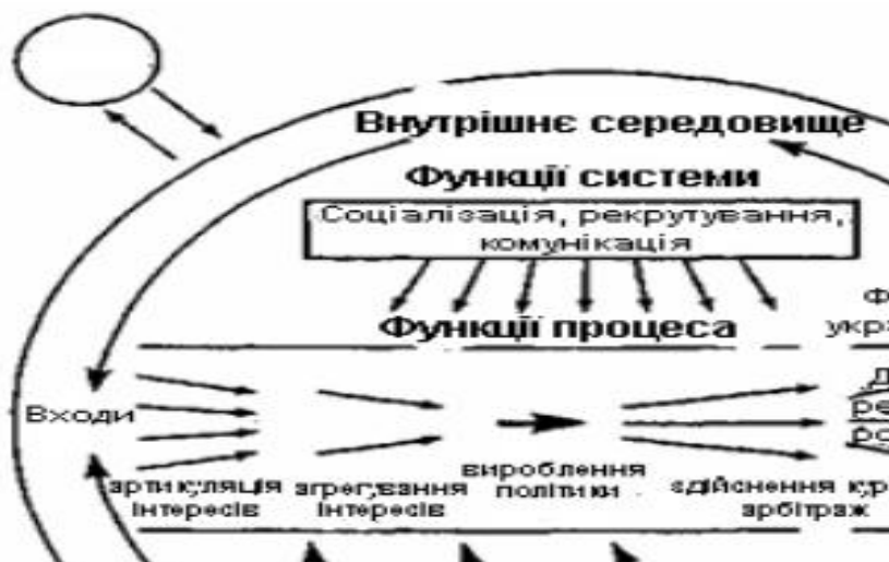
Рис. 1.2.4. Модель політичної системи за Алмондом [204]