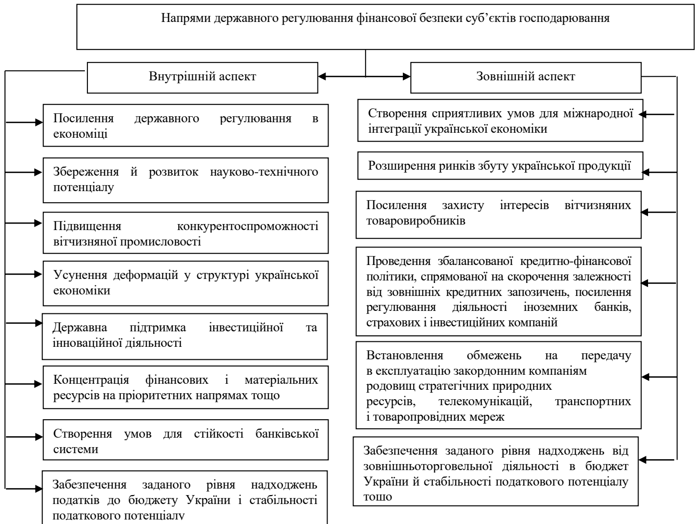
Рис. 2. Напрями державного регулювання фінансової безпеки суб'єктів господарювання (побудовано автором)

У другому розділі – «Особливості державного регулювання фінансової безпеки суб'єктів господарювання» – удосконалено концептуальні положення фінансово-бюджетної безпеки; розвинуто підхід до формування державного регулювання фінансової безпеки суб'єктів господарювання в умовах євроінтеграції; удосконалено елементи державного фінансового контролю.