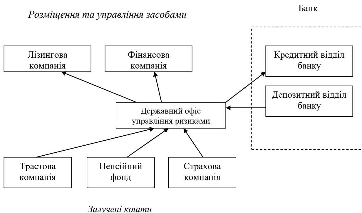
Рис. 3. Механізм державного регулювання страховими та фінансовими резервами для забезпечення фінансової безпеки суб'єктів господарювання

Зазначено, що створення об'єднаної фінансової структури дає змогу також подолати деякі законодавчі перешкоди. Для страхових компаній зазвичай існує заборона на розміщення резервів у кредити й акції, тому банківський бізнес є привабливим для страхових компаній з погляду можливості управління своїми страховими резервами (рис. 3).