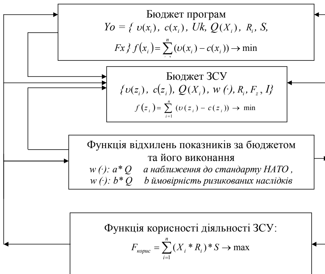
Рис. 3. Функціональна модель оптимізації розподілу та використання бюджетних коштів на програми

У моделі використано такі позначення: c(x_i) – функція витрат при виконанні i -ї статті бюджету програми; c(z_i) – функція витрат при виконанні i -ї програми бюджету; S = \frac{X^{Special}}{X^{Total}} – співвідношення спеціального фонду до загального фонду; R_i – рівень ризику невиконання бюджетних програм ЗСУ; \sum_{i=1}^N Q(X_i) – обмеження на розподіл бюджету за програмами; \sum_{i=1}^N v(x_i) \leq F_x – обмеження функції планування витрат при виконанні i -ї статті бюджету програм відповідно до розподілу бюджету за стандартами НАТО.