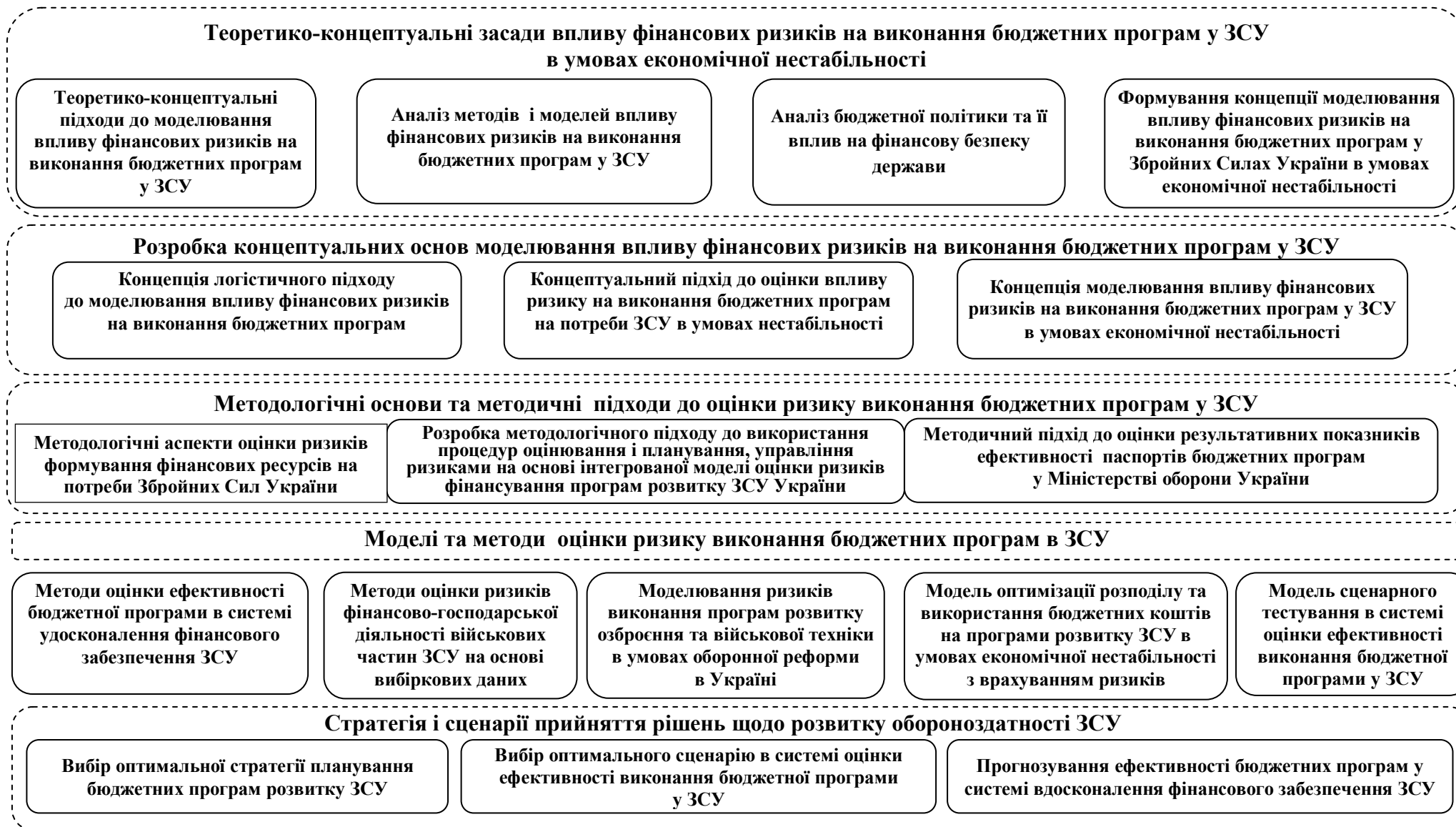
Рис. 2. Концепція моделювання впливу фінансових ризиків на виконання бюджетних програм у Збройних Силах України в умовах економічної нестабільності