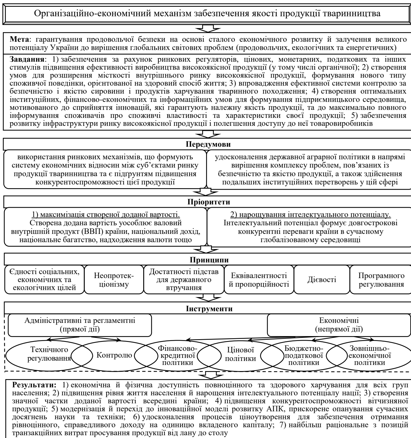
Рис. 1. Концептуальні елементи ОЕМЗЯ продукції тваринництва (сформовано автором)

Обґрунтовано концептуальні елементи організаційно-економічного механізму забезпечення якості (ОЕМЗЯ) продукції тваринництва (рис. 1).