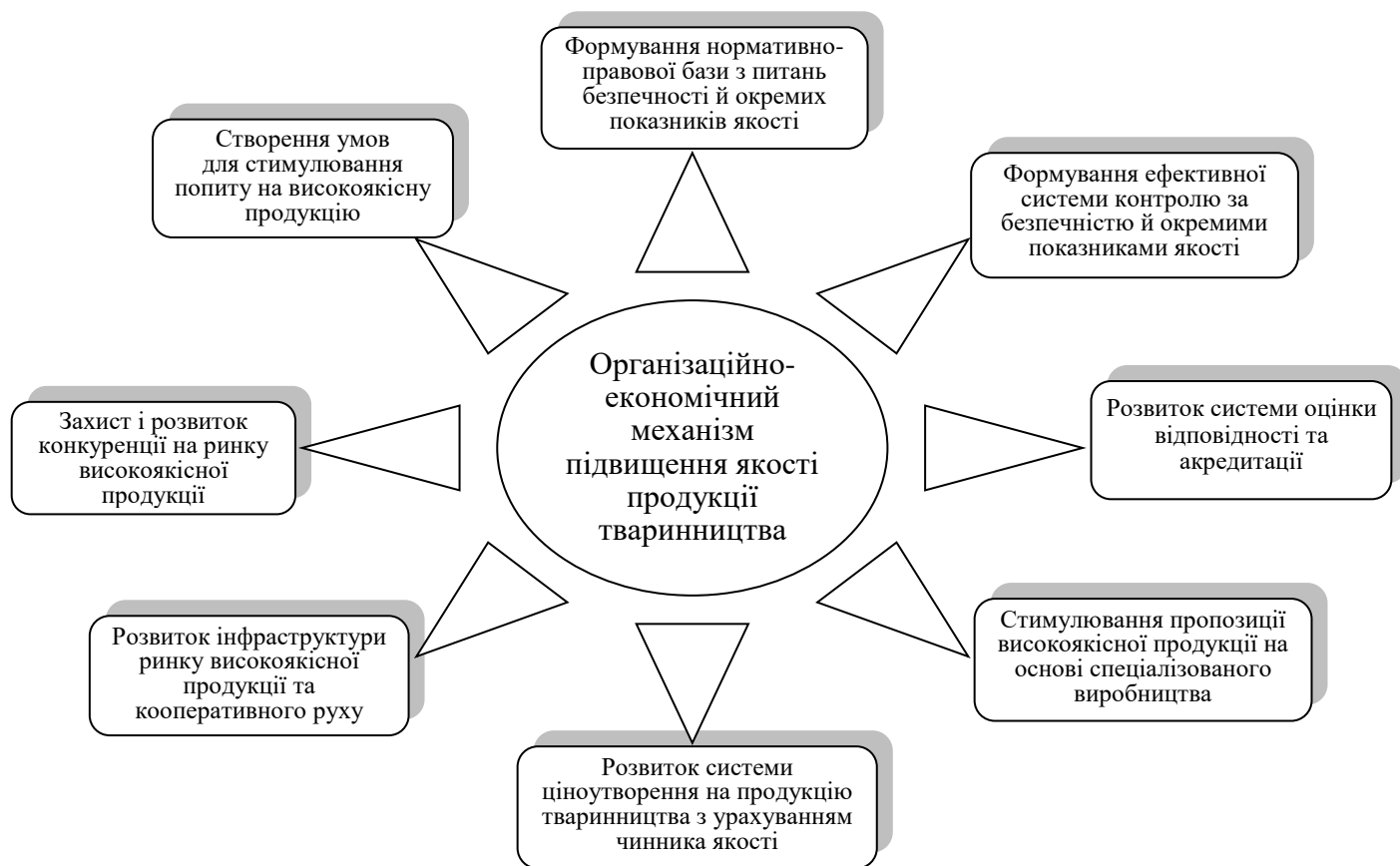
Рис. 2. Схема ОЕМПЯ продукції тваринництва в Україні на основі системних змін (сформовано автором)

Запропоновано теоретичну модель ОЕМПЯ продукції тваринництва, яка передбачає комплексне застосування ринкових регуляторів та інструментів цінової, монетарної, бюджетно-податкової, інвестиційно-інноваційної й зовнішньоекономічної політики, а також реалізацію системи заходів, що охоплюють основні елементи процесу підвищення якості продукції тваринництва та згруповані у вісім базових напрямів у межах двох блоків. Блок 1 об'єднує заходи організаційного характеру та вміщує три базові напрями підвищення якості продукції тваринництва (рис. 3).