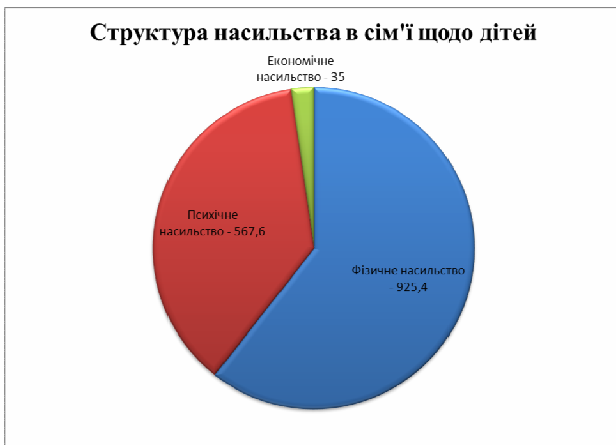
Рис. Б.1. Середні арифметичні показники насильства в сім'ї щодо дітей за 2013–2017 рр.