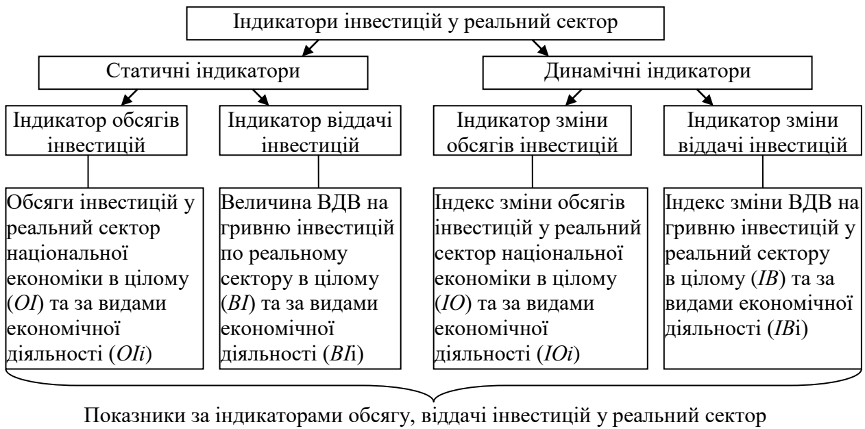
Рис. 3. Система показників за індикаторами інвестицій у реальний сектор (побудовано автором)

На основі значень індикаторів економічних, соціальних та екологічних результатів розраховано узагальнюючий індикатор результатів функціонування реального сектору IR_s :