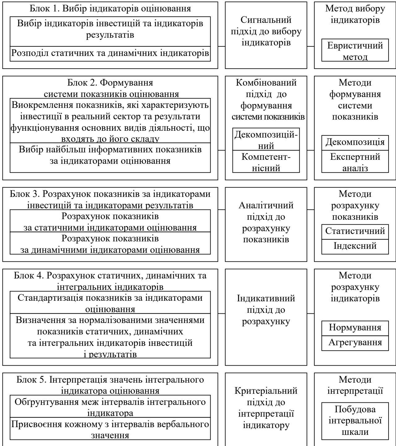
Рис. 2. Методичний інструментарій індикативного оцінювання у сфері управління інвестиціями в реальний сектор (побудовано автором)

Сформована система показників, що відповідають індикаторам обсягу та віддачі інвестицій у реальний сектор, а також індикаторам їхньої зміни, наведена на рис. 3.