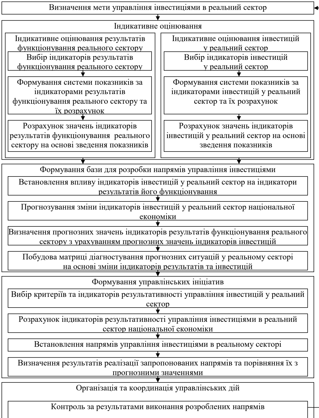
Рис. 1. Підхід до управління інвестиціями в реальний сектор (побудовано автором)

На основі програмно-цільового розроблено авторський підхід до управління інвестиціями в реальний сектор національної економіки, що передбачає виконання ряду етапів, найбільш значущим з яких є індикативне оцінювання (рис. 1).