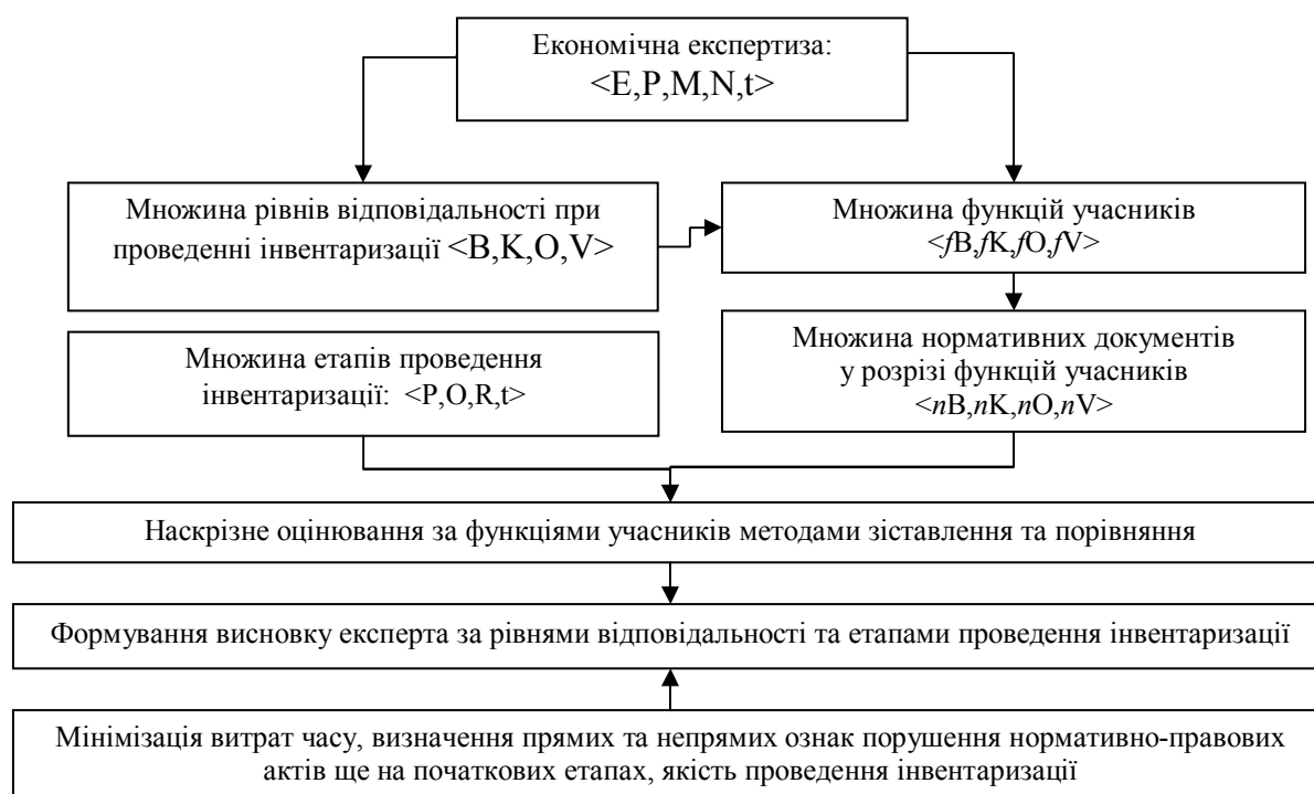
Рис. 5. Структурно-функціональна модель проведення економічної експертизи матеріалів річної інвентаризації (де В – бухгалтерія, К – керівник, О – матеріально-відповідальні особи, V – владні структури; P – початковий, O – основний, R – підсумковий; E – мета експертизи, P – експерт, M – метод проведення експертизи, N – відповідне нормативно-правове забезпечення, t – період дослідження).

Охарактеризовано обмеження експерта в процесі обґрунтування висновків, етапи проведення інвентаризації, функції та рівень відповідальності учасників, що дало змогу вдосконалити методику проведення економічної експертизи результатів інвентаризації. Модель (рис. 5) дає змогу спростити проведення економічної експертизи шляхом наскрізного дослідження встановлених взаємозв'язків між учасниками за рівнями їх відповідальності, неузгодженість дій на окремому рівні буде свідчити про порушення й на інших рівнях, що значно пришвидшить та звузить пошук експерта. Таким чином, забезпечується системність, точність, логічність, достовірність та швидкість формування висновків економічної експертизи.