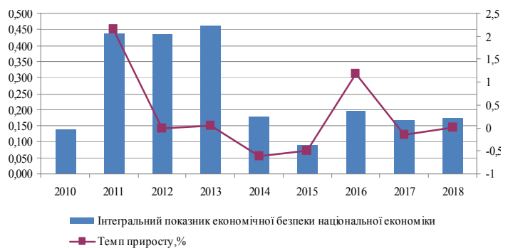
Рис. 2. Динаміка показника, що визначає рівень економічної безпеки національної економіки

У 2018 р. рівень економічної безпеки становить лише 0,172, що на 24,2% більше, ніж у 2010 р., тобто можна говорити про те, що у своєму розвитку рівень економічної безпеки національної економіки став таким, як і дев'ять років тому.